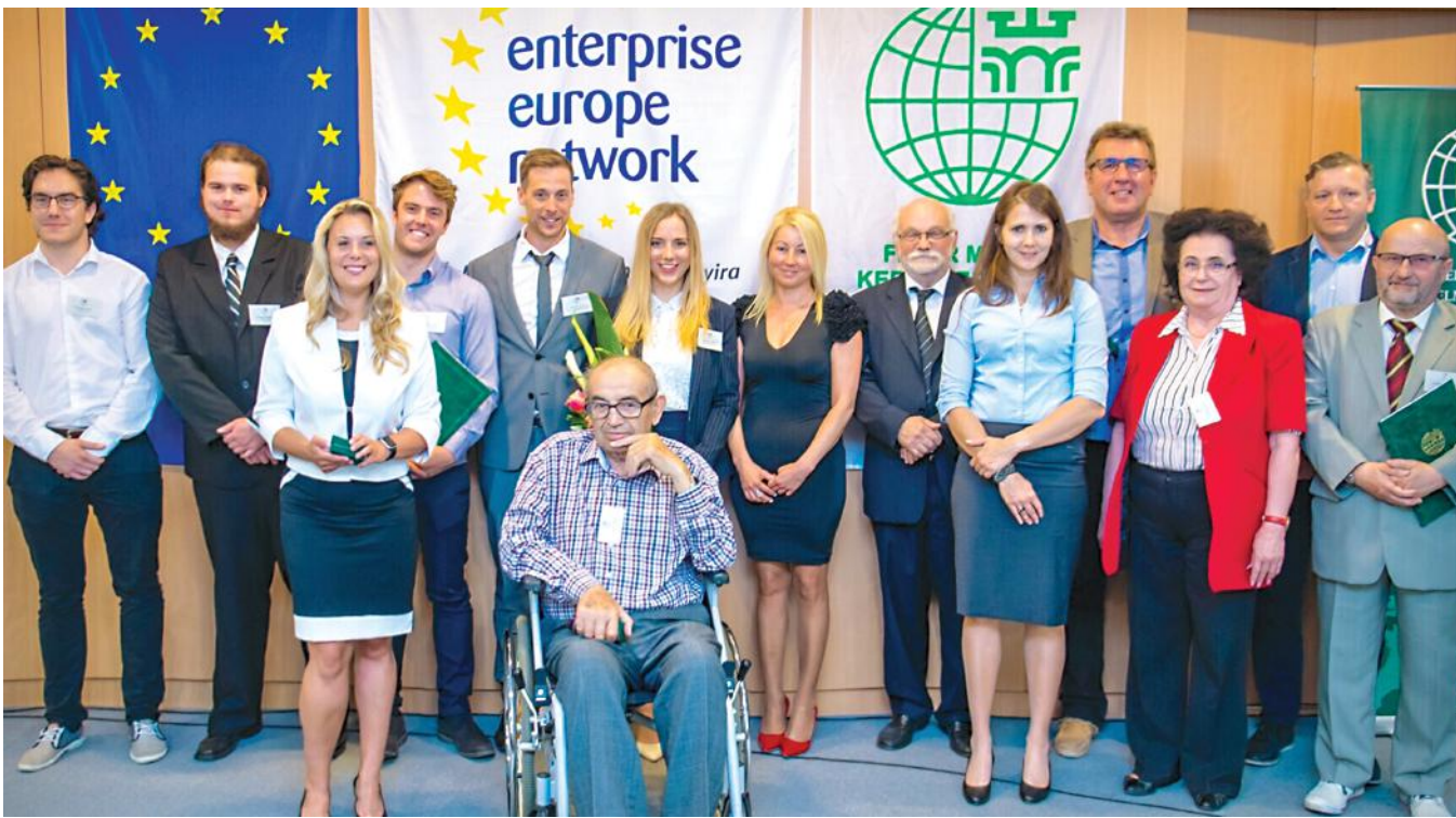
A Fejér Megyei Kereskedelmi és Iparkamara hét díjat adományozott kilenc gazdasági szereplő számára

A kamara közösségteremtő munkája hozzájárul a megye vállalkozásainak sikeréhez – foglalmazták meg többen a Fejér Megyei Kereskedelmi és Iparkamara május 24-én a Gazdaság Házában tartott küldöttgyűlésén, melynek keretein belül a kamarai díjakat is átadták.