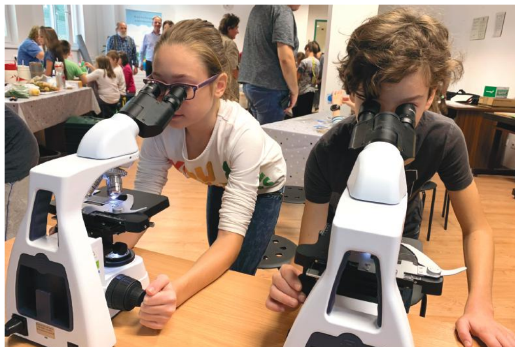
A nyitófoglalkozáson a Munkácsy Mihály Általános Iskola ötödikes diákjai vettek részt