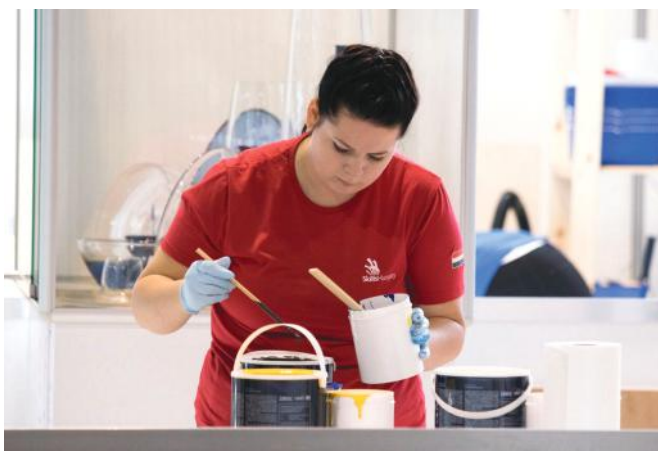
Sárvári Ágnes Kiválósági Éremet szerzett

– Ezer szállal kötődöm Székesfehérvárhoz: itt van a családom nagy része, itt éltem én is évekig, és nem utolsó sorban a megyeszékhelyen – a