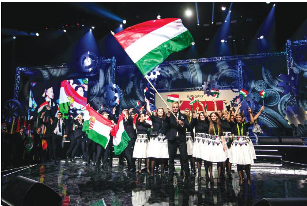
A magyar csapat 17 versenyszakmában ért el helyezést