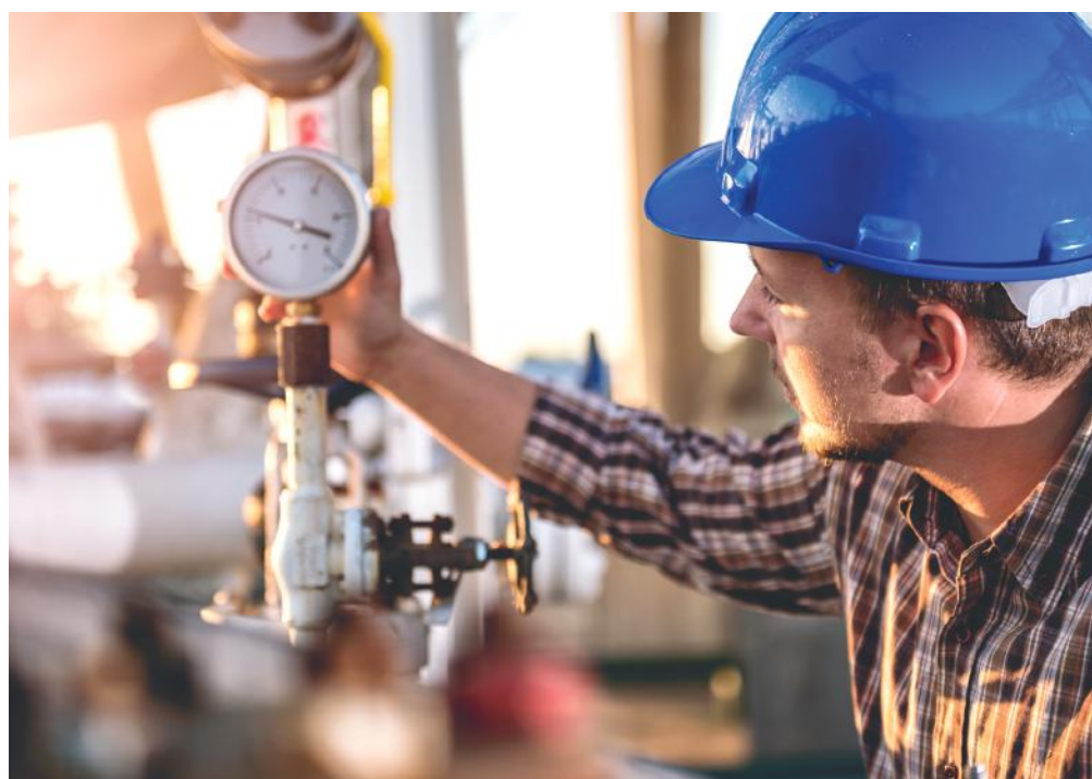
Energiaszolgáltatás Magyarországon: mit érdemes tudni?

Míg a gáz- és villamosenergia-szolgáltatásban jellemzően országos-, részben regionális, addig a hőszolgáltatásban lokális szereplők vannak. A hőszolgáltatást az adott településen lévő erőműből, vagy hő-központokból főként önkormányzati, vagy magán-tulajdonú vállalkozások biztosítják. A