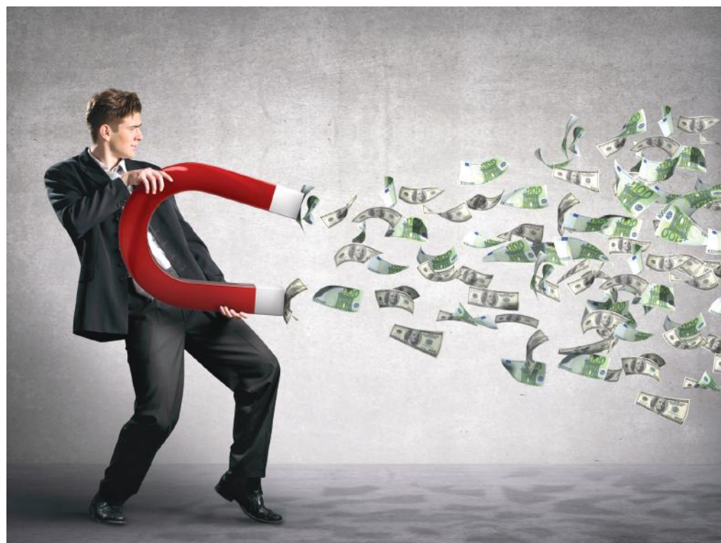
Piac és Profit konferenciasorozat a Gazdaság Házában, 2018. október 25., 9.30

A konferencia térítésmentes, de előzetes regisztrációhoz kötött! Bővebb információ, jelentkezés: www.fmkik.hu .