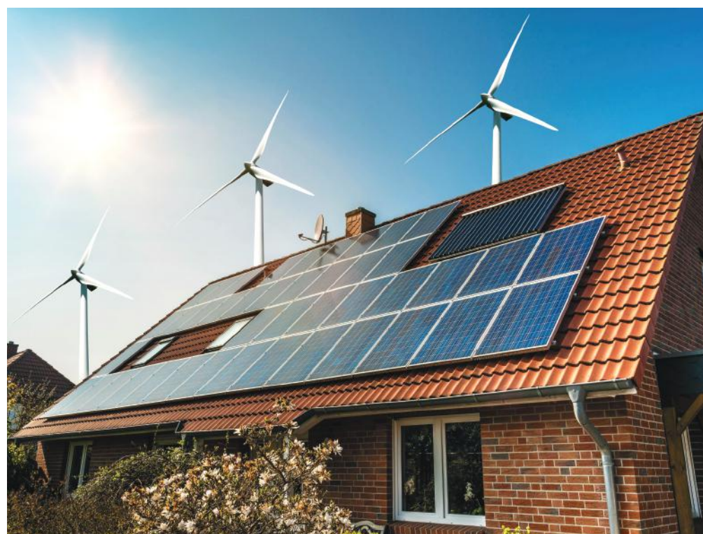
Már csak a közel nulla energiaigényű épületek követelményszintje szerint érdemes gondolkodni

Az FMKIK Építőipari tagozata 2018. őszi tájékoztató fórumot szervez a témában, a Gazdaság Házában, mely nyitott lesz a szakma és az érdeklődő lakosság számára is. A kamara honlapján – www.fmkik.hu – érdemes tájékozódni majd a program pontos időpontjáról.