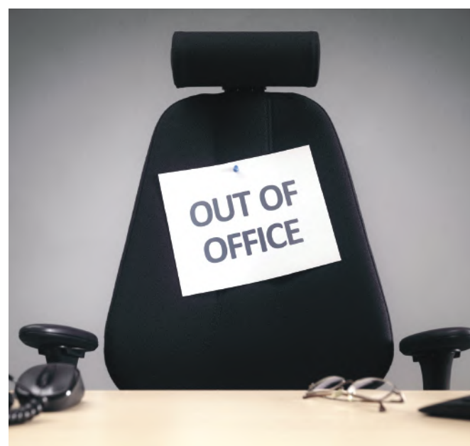
A cégeknek nemcsak a munkavállalók, hanem a beszállítóik igényeit is figyelembe kell venni a szabadságok kiadásakor

A Munka Törvénykönyvében szabályozott fizetett szabadság kiadásának alapvető szabályai nem változtak 2018-ban. Az összes fizetett szabadság az alapszabadságból és a több címen is járó pótszabadságokból tevődik össze. A Munka Törvénykönyvében számszerűsített szabadságnapok a teljes évben dolgozóakra vonatkoznak, vagyis tört évben arányosan kevesebb a szabadságnapok száma. Az, hogy a rendszeres napi munkavégzés során a munkavállaló hány órát dolgozik, a szabadság szempontjából lényegtelen. Részmunkaidős foglalkoztatás esetén is teljes szabadság jár. A szabadságot – a munkavállaló előzetes meghallgatását követően – a munkáltató adja ki; a szabadság kiadása a munkáltató joga és kötelezettsége.