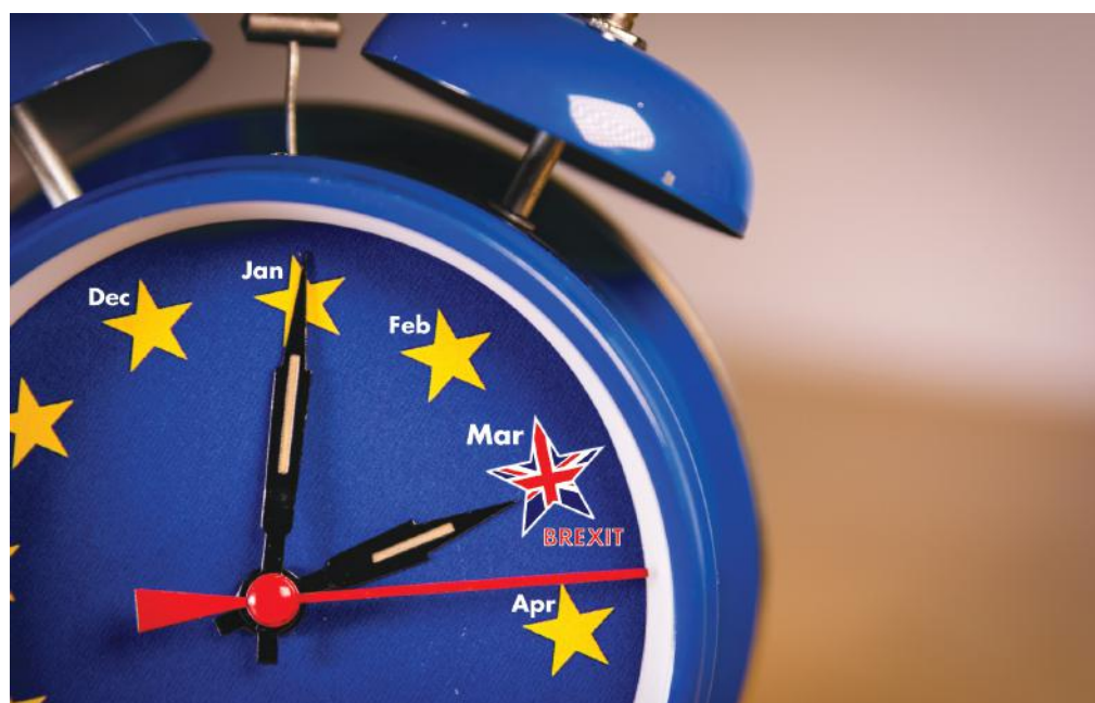
Konzultáció a BREXIT-ről: 2019. február 14., csütörtök, 9.00 óra, Gazdaság Háza

Mint mondta, a kilépést követően az Egyesült Királyság és az EU gazdaságai továbbra is szoros kapcsolatban maradnak. A briteknek jelenleg is kiterjedt kereskedelme van EU-n kívüli országokkal, ami létező szabályozás mellett működik. Céljuk a folytonosság és stabilitás, hogy gazdaságuk fennakadás nélkül működjön. 'No deal' Brexit esetén a kereskedelem a Világkereskedelmi Szervezet által definiált nem preferenciális kereskedelmi alapon folytatódik, az írásban megírt irányadó a Belfasti Megállapodást. A britek arra készülnek, hogy az átmeneti időszakban a 3. országokkal folytatott szabályozásait alkalmazzák. Nyilván lassulni fog az adminisztráció, a fizikai folyamatok, megnő a naprakész tájékozottság jelentősége. Segít, ha egy vállalkozás brit és EU oldalról informált. Az Eurogate ennek megfelelően tájékoztatja ügyfeleit és a hozzá forduló vállalkozásokat.