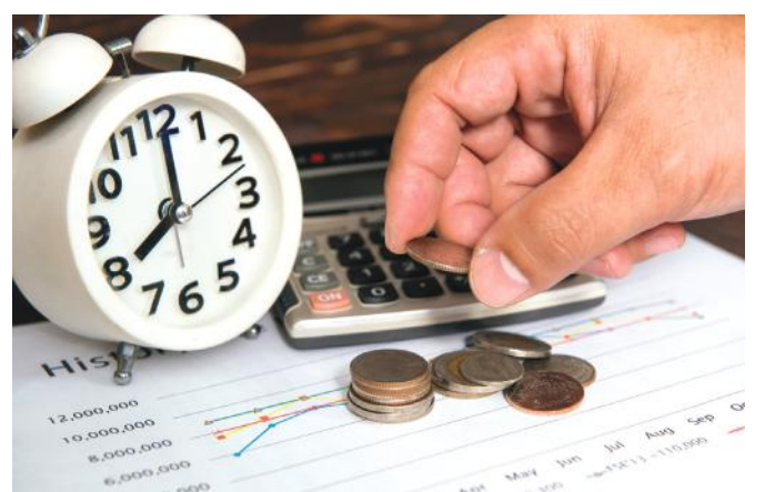
A változás – többek között – a munkaidő beosztást is érinti

Kollektív szerződés rendelkezése alapján továbbra is legfeljebb évi 300 óra rendkívüli munkaidő rendelhető el, de ezen felül – ha a munk-