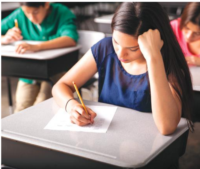
FMKIK-nál az írásbeli elődöntőkre 2019. január 7-24. között kerül sor

Az írásbeli elődöntőket a területi kereskedelmi és iparkamarák bonyolítják. A Fejér Megyei és Kereskedelmi Iparkamara szervezésében, 32 szakmában közel 300 tanuló részvételével kerül sor