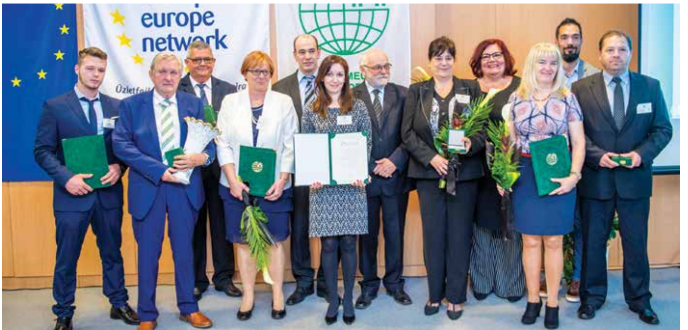
Az FMKIK nyolc díjat adományozott tizenegy kiemelkedő és példaértékű tevékenységet végző gazdasági szereplő számára

A kamara közösségteremtő munkája hozzájárul a megye vállalkozásainak sikeréhez – foglalmazták meg többek között a Fejér Megyei Kereskedelmi és Iparkamara május 23-án tartott küldöttgyűlésén, melynek keretein belül kamarai díjakat is átadtak.