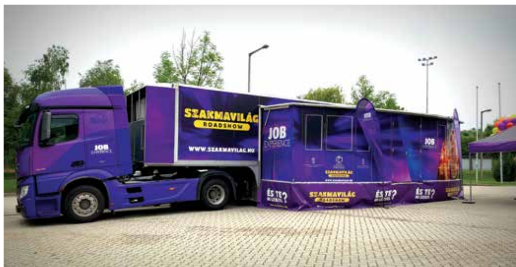
Több, mint 600 pályaválasztás előtt álló diák vett részt a Szakmavilág roadshow Fejér megyei programjain

A program az NFA-KA-ITM-4/2018/TK/07 támogatási szerződés alapján valósult meg.