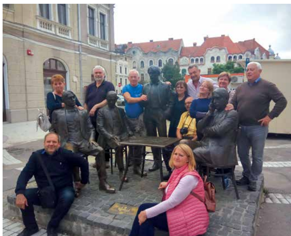
A Fejér Megyei Kereskedelmi és Iparkamara égisze alatt működő PLATO csoport